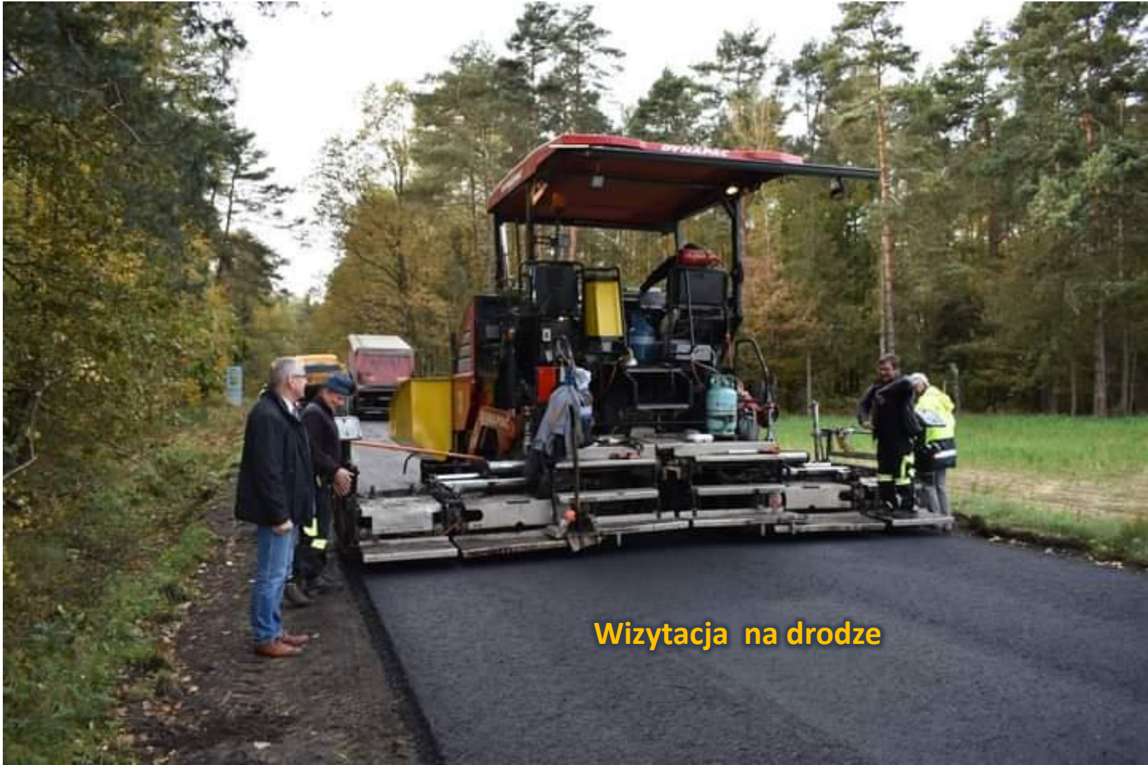
Wizytacja na drodze